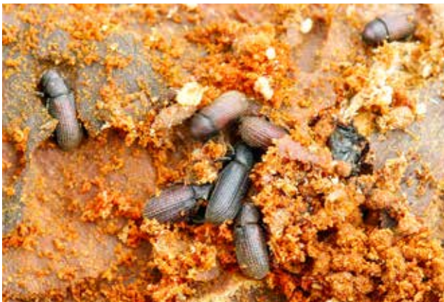
Hylastes ater & Hylastes opacus højsandet