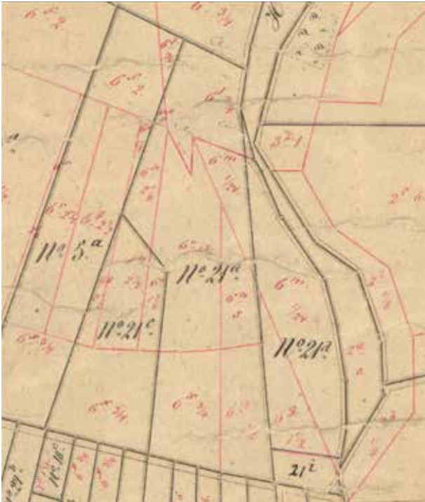
Matrikelkort 1879-1891 Matr. 21a fremgår tydeligt. Matr. 21n blev senere udstykket fra den nordlige del af 21a.