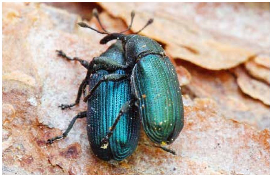
Magdalis frontalis hun & han.

Denne lægger sine æg i barksprækkerne og billelarven lever efterføl-