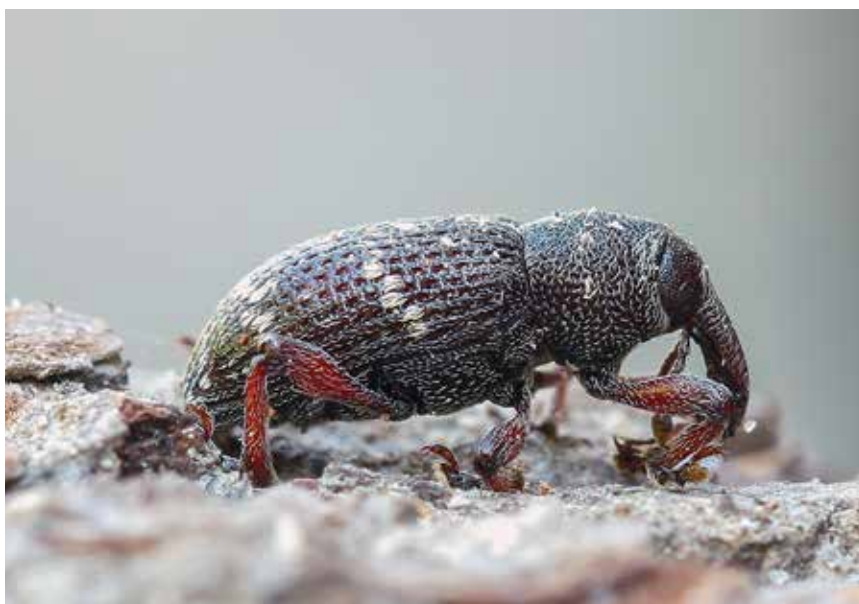
Den sjældne snudebille Hylobius pinastri .