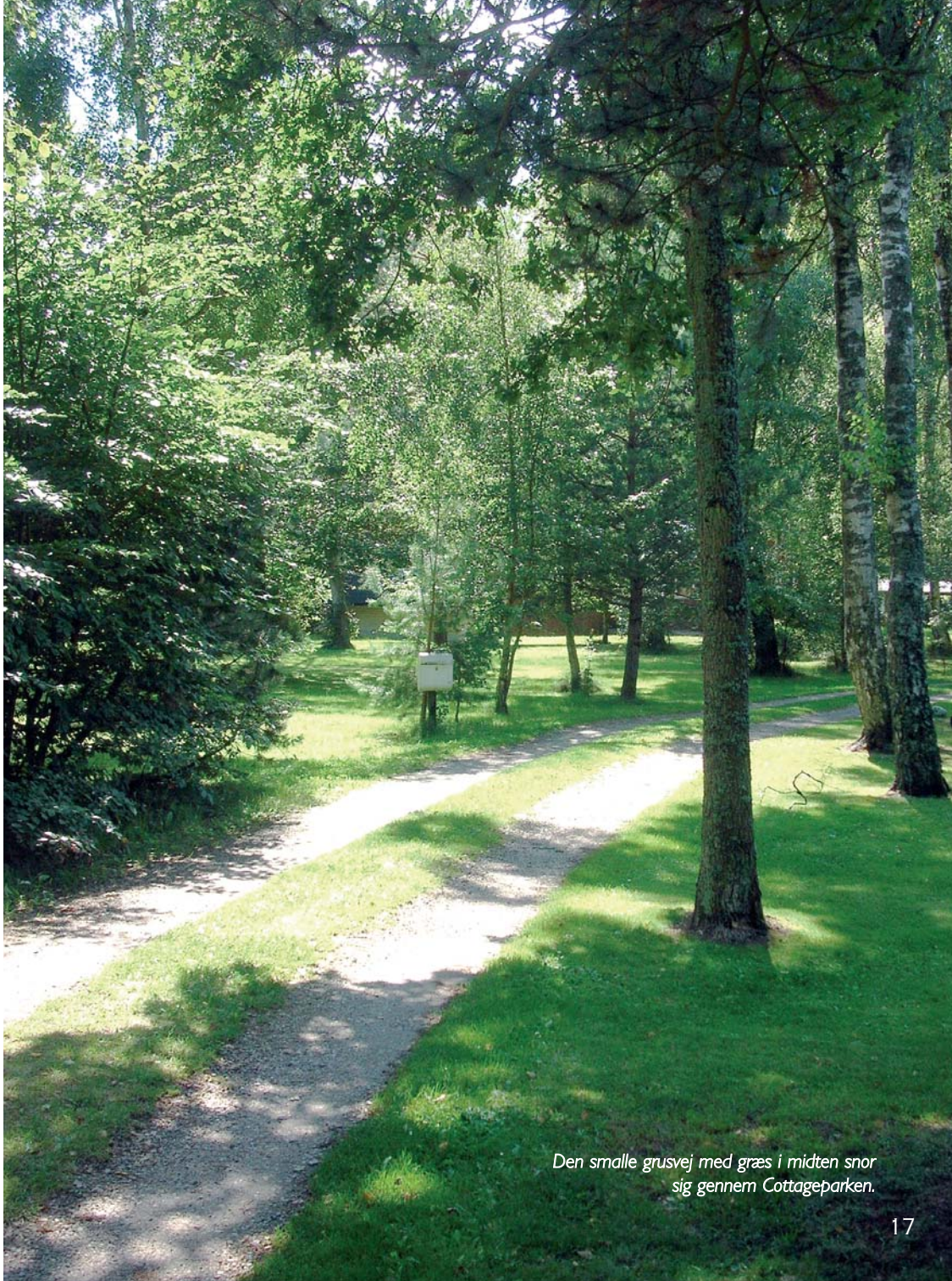
Den smalle grusvej med græs i midten snor sig gennem Cottageparken.