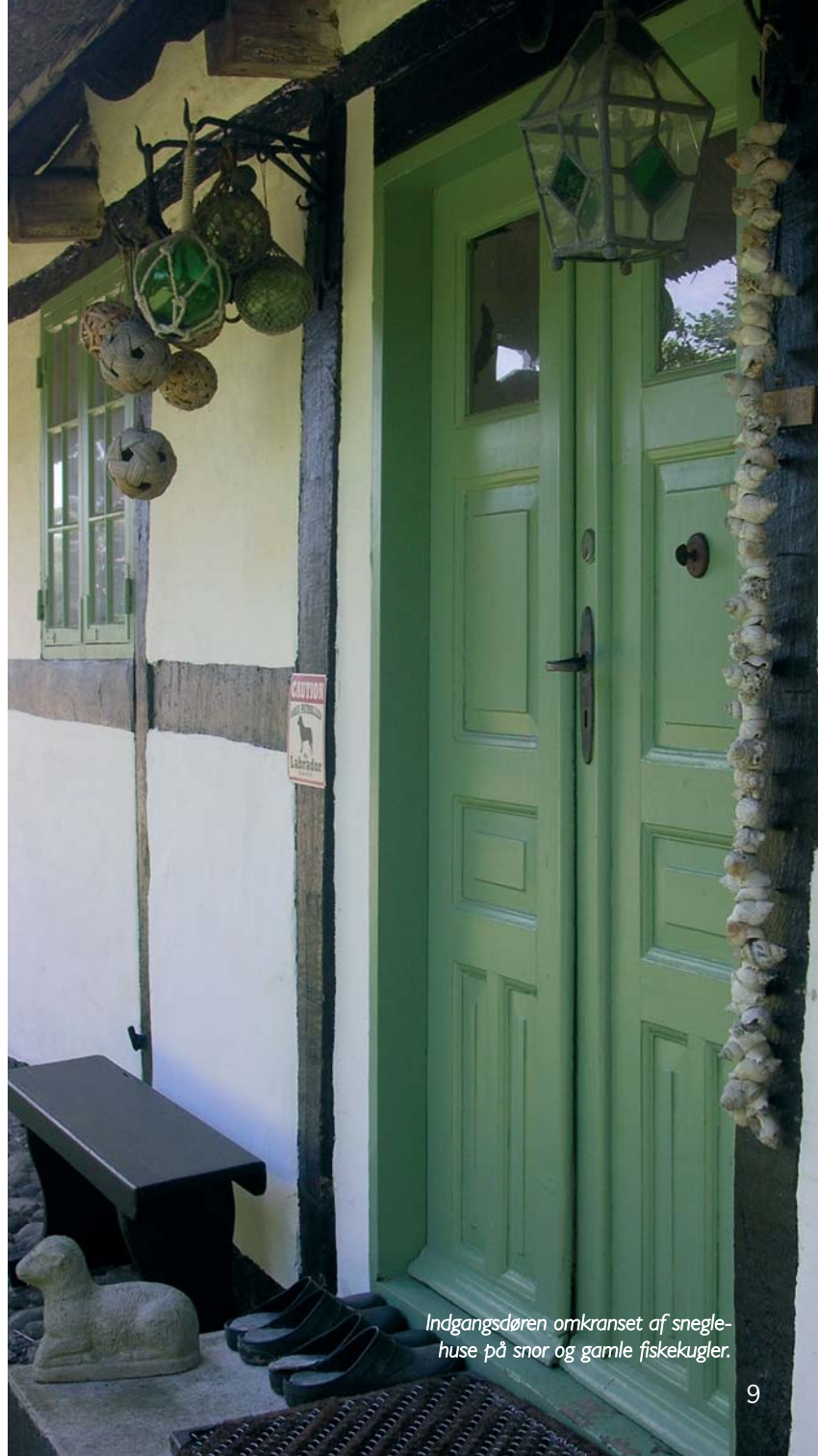
Indgangsdøren omkranset af snegle- huse på snor og gamle fiskekugler.