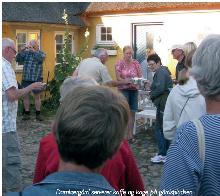
Damkærgård serverer kaffe og kage på gårdspladsen.