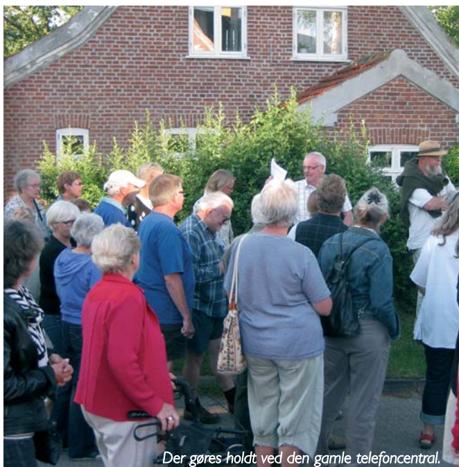
Der gøres holdt ved den gamle telefoncentral.