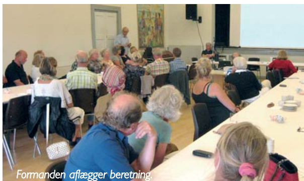
Formanden aflægger beretning.