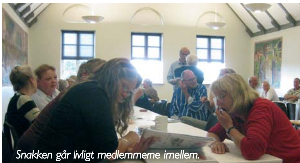
Snakken går livligt medlemmene imellem.