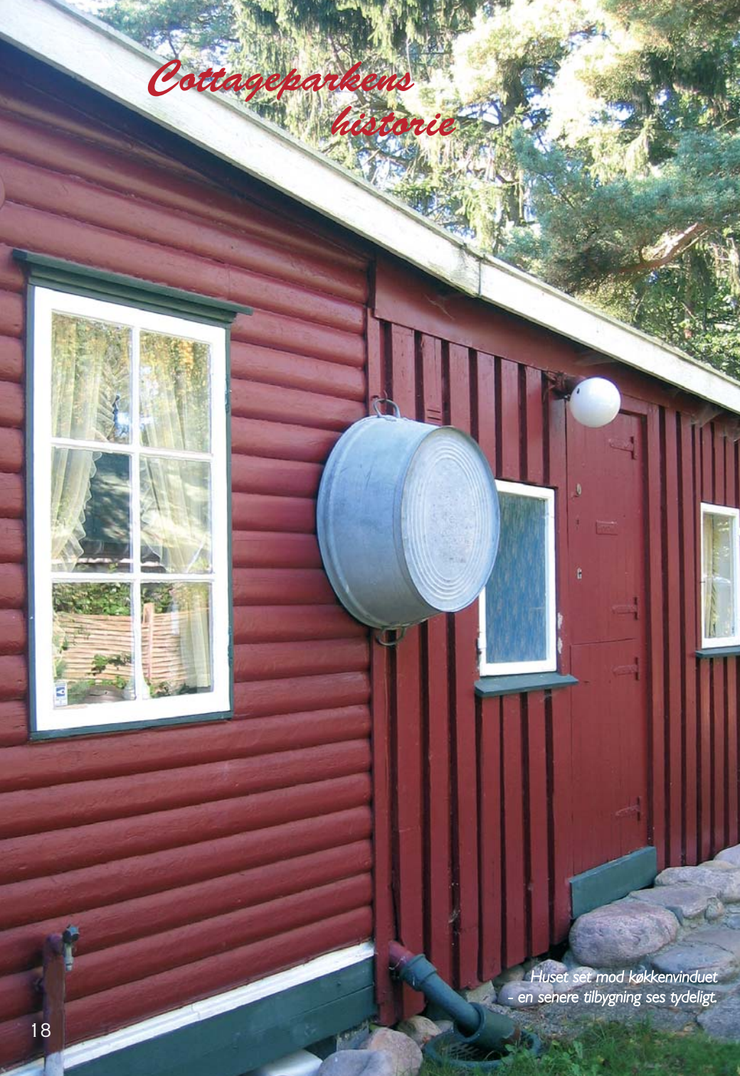
Huset set mod køkkenvinduet - en senere tilbygning ses tydeligt.

posten/pakker til sognets beboere (postmester) og samtidig havde et apotekerudsalg, samt murermester Ritzau og hustru. Vi børn legede sammen med deres børn og blev derved en naturlig del af ungdommen/børnene i Rørvig.