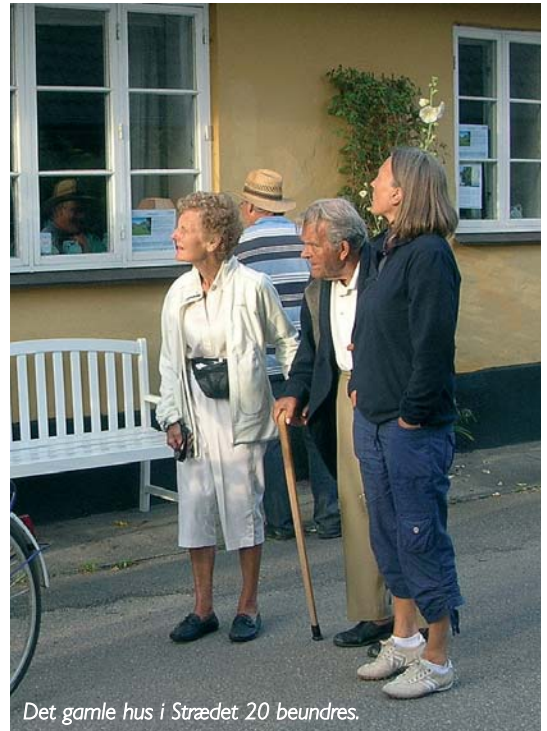
Det gamle hus i Strædet. 20 beundres.