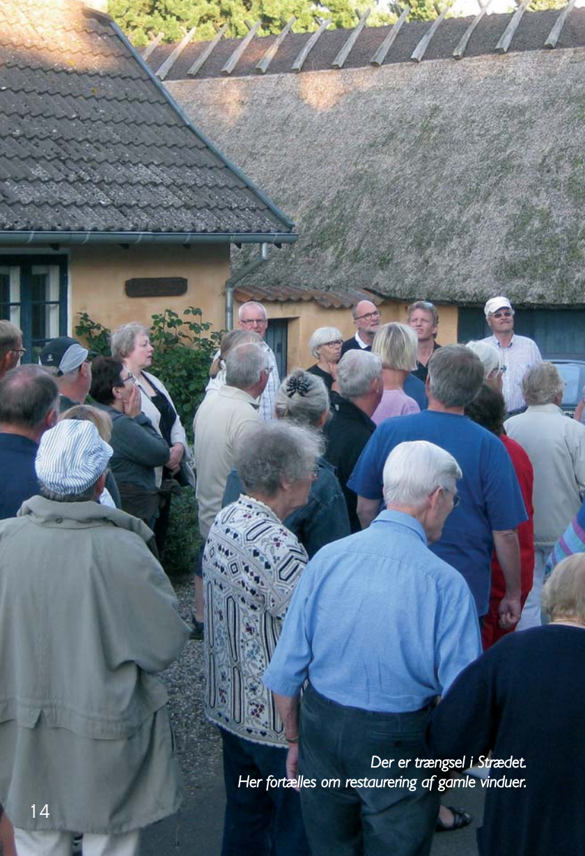
Der er trængsel i Strædet. Her fortælles om restaurering af gamle vinduer.

Den 12. og 26. juli havde foreningen arrangeret to byvandring med guide i det gamle Rørvig.