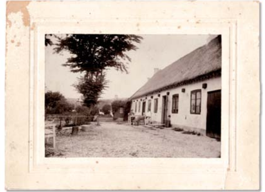
Sydfacaden før, under og efter renovering - nu uden karnapper i stråtaget og med fritlagte stolper.