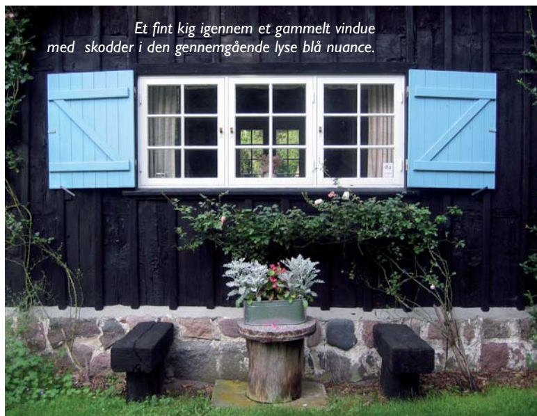
Et fint kig igennem et gammelt vindue med skodder i den gennemgående lyse blå nuance.

Til forskel fra en typisk weekend i et sommerhus i dag, hvor afslapningen ikke er lige så udtalt. Tænk blot på alt det grej og hvilken maskinpark, man kan udstyres med fra et bygge marked, fordi man har et fritidshus. Der er altid lige noget, der skal males, klippes, beskæres eller fældes. En spa der skal renses eller tagrender det samme. Krukker der skal plantes til og vandes osv.