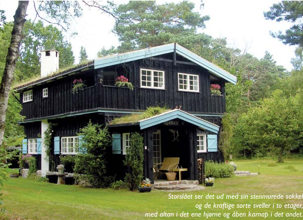
Storslået ser det ud med sin stensemurede sokkel og de kraftige sorte sveller i to etager, med altan i det ene hjørne og åben karnap i det andet.

Rørvig er en perle, som er værd at bevare. Ikke bare selve byen med dens mange smukke huse, men i lige så høj grad sommerhusene, og især de gamle velbevarede, som har et vingesus af storhed over sig. Storhed - fordi det var det bedre borgerskab, som fandt hertil i 20'erne for at finde ro og fred fra datidens hektiske hverdag i storbyer. Her samlede man familien omkring sig i mange sommeruger, og det var således ikke ualmindeligt, at der var både ti eller flere sovepladser, hvorfor man byggede i højden med de tilhørende gæsteværelser og værelser til tjenestefolk. Enten var værelserne udstyret med datidens servanter, eller det mere moderne, en håndvask.