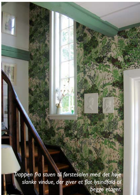
Trappen fra stuen til førstesalen med det høje slanke vindue, der giver et flot lysindfald til begge etager.

I 1943 blev huset overtaget af den nuværende ejers familie. Faderen var civilingeniør og belyningschef på Carlsberg, og helt efter datidens normer tog fru en ophold på landet, medens herren kørte til og fra i weekenderne.