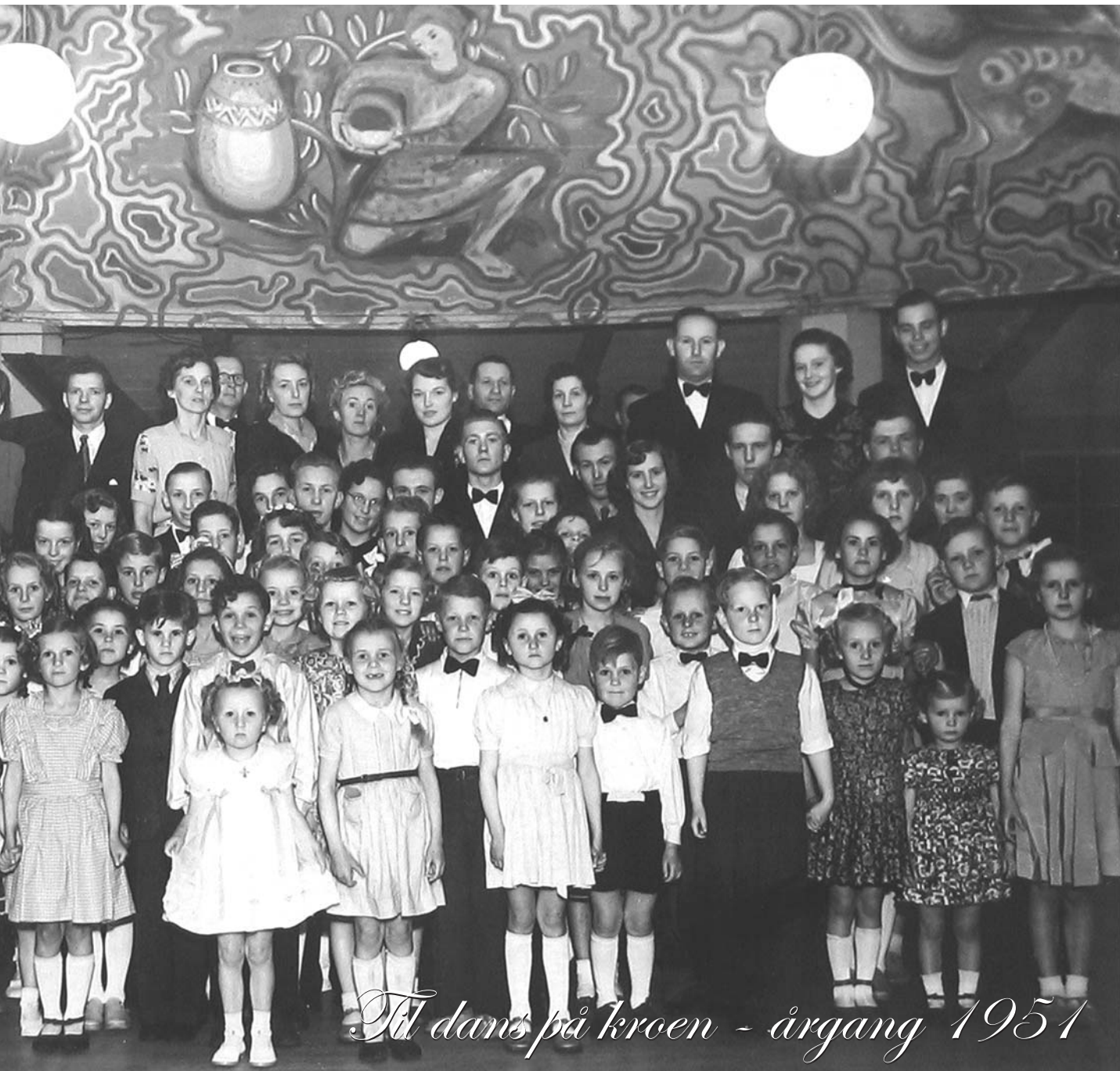
Til dans på kroen - årgang 1951