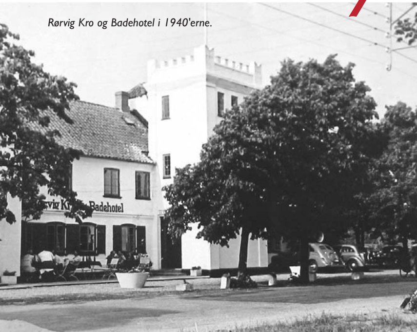
Rørvig Kro og Badehotel i 1940'erne.