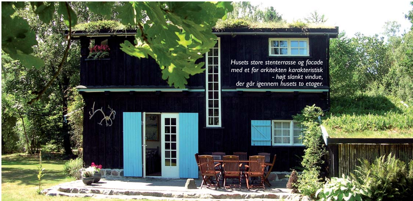
Husets store stenterrasse og facade med et for arkitekten karakteristisk - højt slankt vindue, der går igennem husets to etager.

Her slappede man af. De voksne med passiar fra liggestolene. Børnene fandt sammen med nabofamiliens børn og havde et eldorado af en legeplads på de åbne lyngheder og ved standen. Senere samledes man til frokost, hvorefter turen gik til stranden for badning, og om aftenen mødtes hele familien atter til middagen.