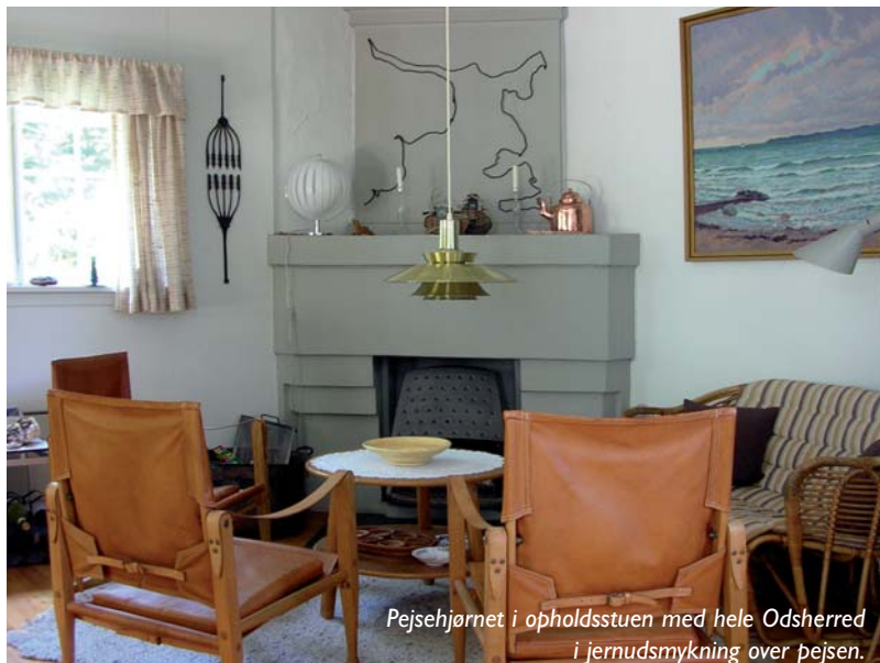
Pejsehjørnet i opholdsstuen med hele Odsherred i jernudsmykning over pejsen.