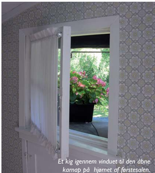
Et kig igennem vinduet til den åbne karnap på hjørnet af førstesalen.