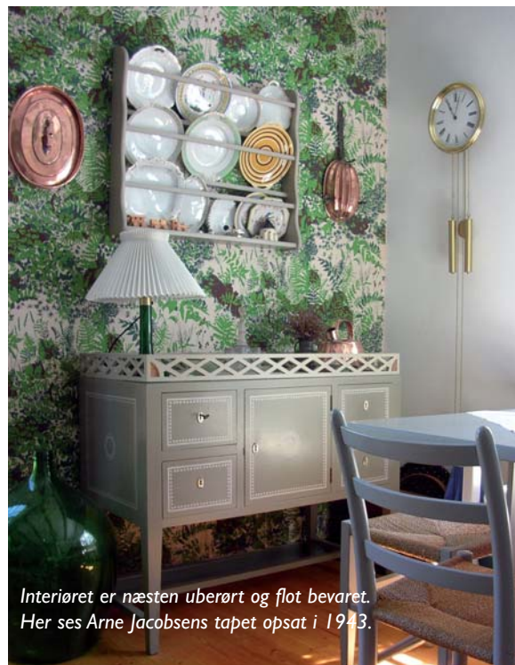
Interiøret er næsten uberørt og flot bevaret. Her ses Arne Jacobsens tapet opsat i 1943.