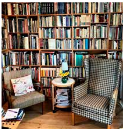
Boghjørnet, tidligere bagersvendens kammer