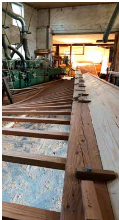
Sammenstød på kværnloft mellem nye beklædningsbrædder og bevarede gamle brædder.