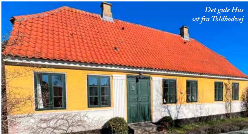
Det gule Hus set fra Toldbodvej

Af Alf Gørup Theilgaard & Birgitte Haag Jespersen