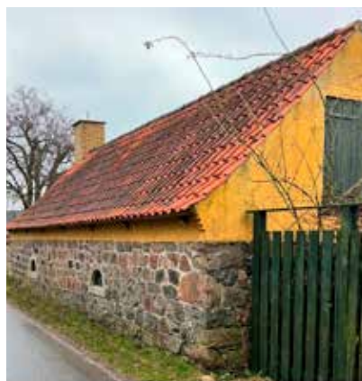
Udhus med kampestensmur mod Nørrevangsvej

Ud over selve skipperhuset består ejendommen af et udhus, bygget i 1898 med en karakteristisk kampestensmur mod Nørrevangsvej. Vi bruger udhuset som værksted og bryggers. Mellem de to huse er et klassisk gårdmiljø med pikstensbelægning og en brønd, der skaber et stemningsfuldt uderum, som vi nyder at opholde os i. Den gule mur mod Toldbodvej er opført i 1970'erne og er langtfra nydelig, men nyttig når sommermylderet sætter ind. Bag muren finder vi ro i vores dejlige hus og have og nyder at have naturen så tæt på hele året. Trods nordjysk baggrund har vi slået rødder her.