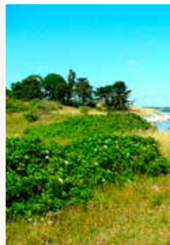
Stemmingsbilleder Rørvig by og land