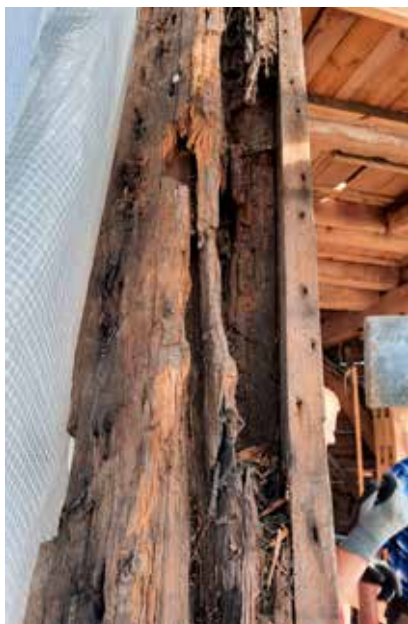
Kraftige rådskader i et af møllens højben