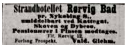
Nationaltidende 2. juni 1908, s.1