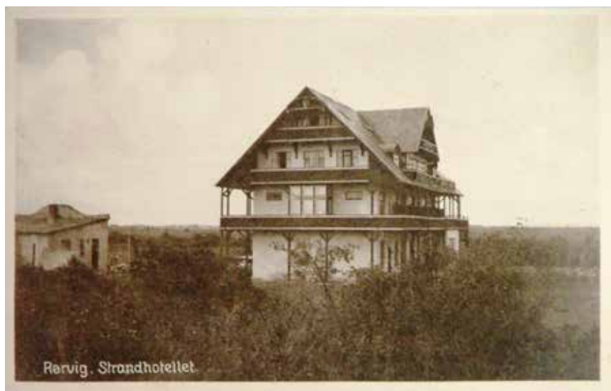
Bevoksningen gør nu, at stedet har skiftet karakter. Bemærk den nye anneksbygning til venstre.