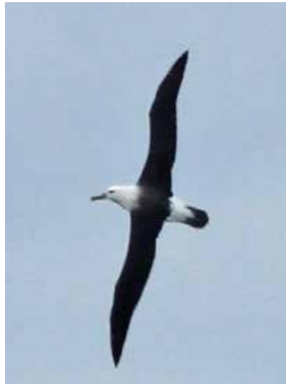
Rørvig albatrossen fotograferet udfør Nødebohuse. Bemærk vingernes to knæk.

3. oktober gik alarmen igen - sortbrynet albatros - sydtrækkende ved kysten udfør Göteborg. Drømmen tændtes igen – en albatros ved Sjælland – eller skulle det blot blive ved med at være utopi. Næste dag blev fuglen meldt fra Laholmsbugten nord for Kullen, hvor den cyklede rundt stort set hele dagen, men videre ville den åbenbart ikke. Først midt på dagen 5. oktober kom den forløsende melding om, at den igen var på vej ud i Kattegat. Spændingen steg, men timerne gik, uden at der kom flere meldinger. Endelig midt på eftermiddagen kom den eftertragtede alarm – albatros ved Liseleje. Det kan nok være, at alle de lokale ornitologer kom af huse i en fart, og efter en lille halv time kunne vi spotte albatrossen NØ for Hundested (ca. 7,5