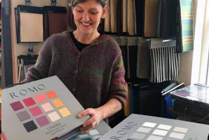
Der er spækket med specialværktøj og alskens farverige tekstiler og snore og tråde, og papegøjen snakker med i baggrunden.