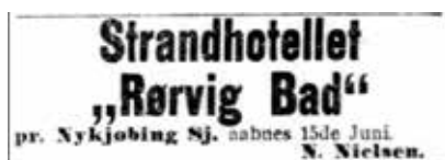
Berlingske Politiske og avertissementstidende 10. juni 1910 s 5