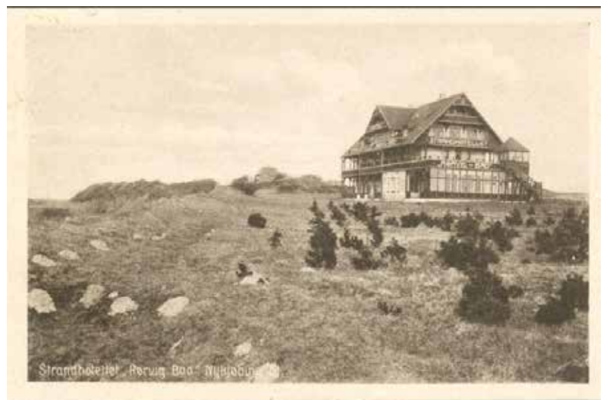
Berlingske Politiske og avertisementstidende 10. juni 1910 s 5