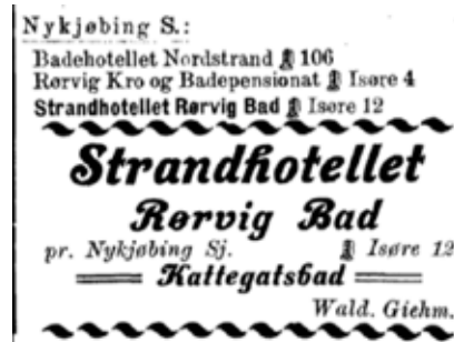
Kraks vejviser 1915 Del 2-1, VII s. 1399.