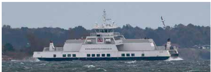
Albatrossen ved Rørvig-færgen.

Som et PS kan nævnes, at jeg i et forsøg på at finde oplysninger om albatrosser i Nordatlanten på nettet fandt nyere oplysninger om, at den engelske fugl fra Shetlandsøerne skulle være mindst 47 år gammel – så i det mindste i teorien kunne den fugl, som jeg så på Hermaness, Shetland i 1977 – være den samme som jeg igen havde fornøjelsen af at se ved Korshage her 40 år efter – rimelig tankevækkende!