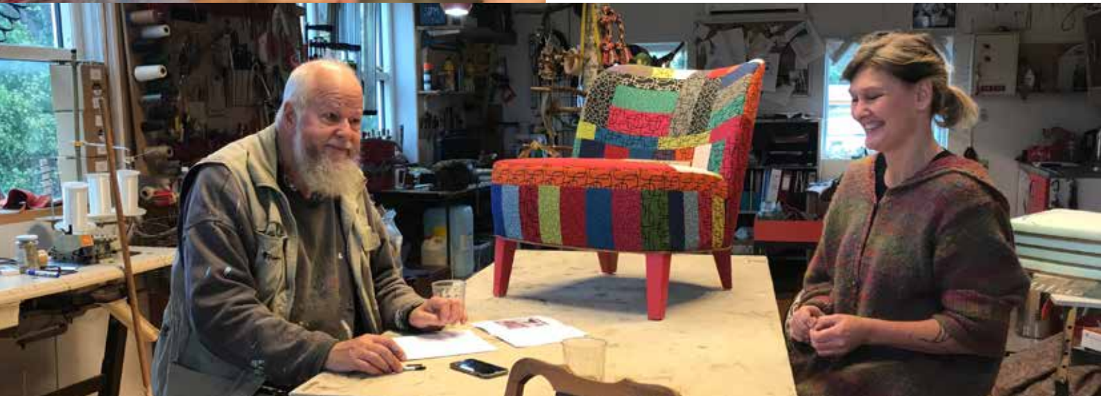
Det plejer at være kunstnere jeg besøger i disse små portrætter, men jeg har valgt ind imellem at vise kunstneriske håndværk.