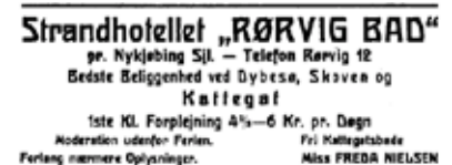
Strandhotellet i Schönbergs Turisthåndbog fra omkring 1911